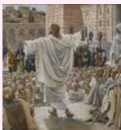
20.30: Rosario a Mad. in C.